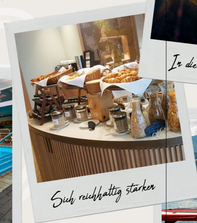
Sich reichhaltig stärken