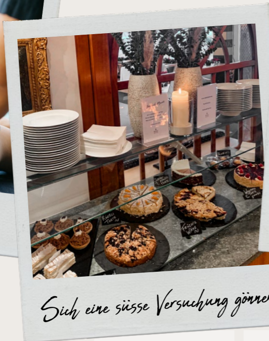
Sich eine süsse Versuchung gönnen