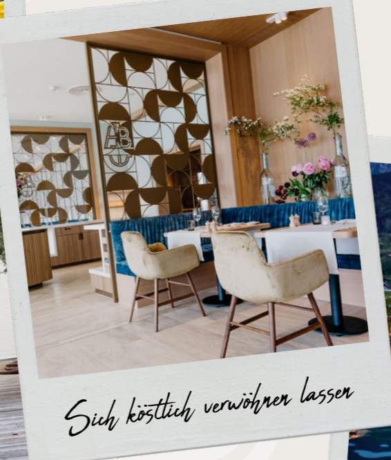
Sich köstlich verwöhnen lassen