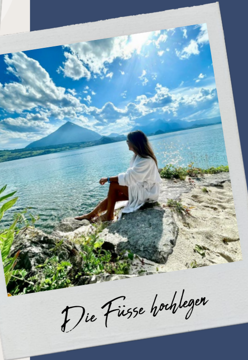
Die Füße hochlegen