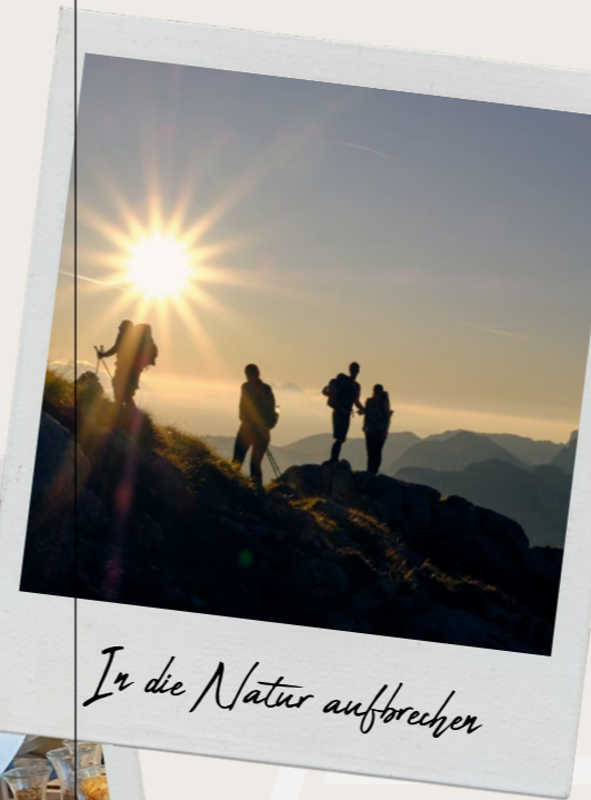
In die Natur aufbrechen