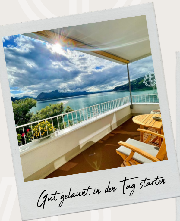
Gut gelaunt in den Tag starten