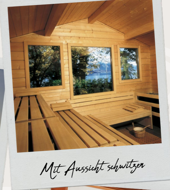
Mit Aussicht schwitzen