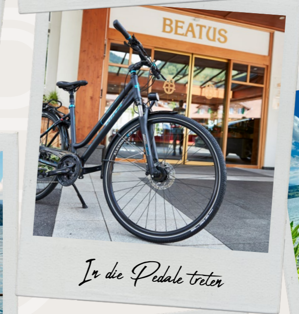
In die Pedale treten