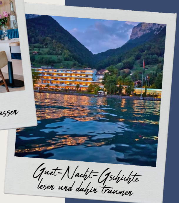
Quet-Nacht-Geschichte lesen und dahin träumen