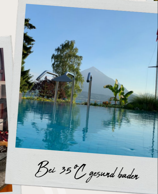
Bei 35°C gesund baden